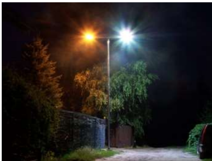
RYСУNEK 3 FOTOGRAFIA PRZEDSTAWIAJĄCA OŚWIETLENIE ŹRÓDŁEM SODOWYM (LEWA STRONA, MOC 75 W) I OŚWIETLENIEM TYPU LED (PRAWA STRONA, MOC 30W),

Porównanie tych dwóch głównych technologii pokazuje w rzeczywistości fotografia zamieszczona poniżej