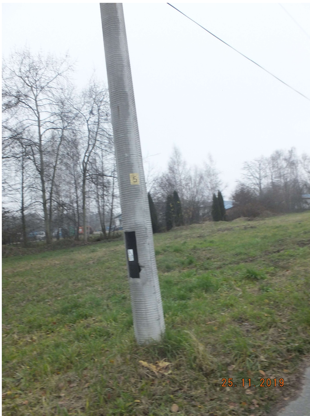
RYSUNEK 1 SŁUP ŻELBETOWY PRZY ULICY PRYWATNEJ